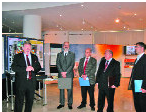
Povești de succes: 0