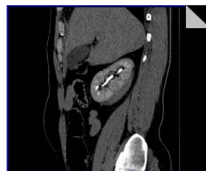
Fig.3 Aplicarea tomografiei computerizate spiralate în leziunile renale traumatice pentru determinarea tacticii de tratament.